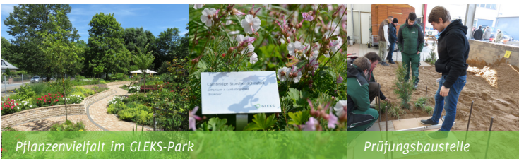
Pflanzenvielfalt im GLEKS-Park