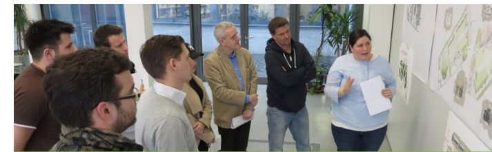
Planpräsentation von Projektarbeiten