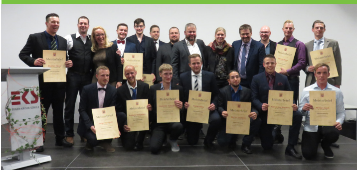
Erfolgreiche Absolventen – Jahrgang 2016 – 2017